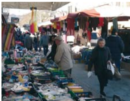
Si confrontano i prezzi prima degli acquisti