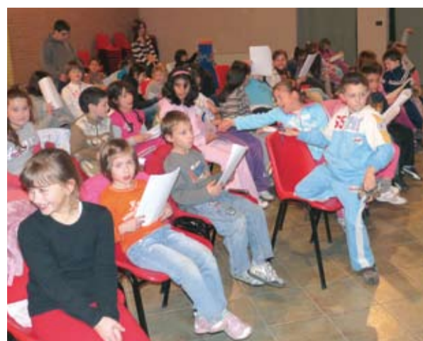
Le prove del coro in vista dell'atteso Zucchini d'oro