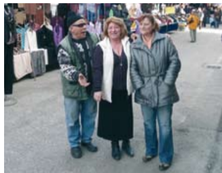
Tre abituali clienti del mercato brusaschese