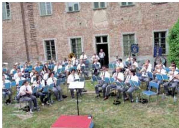
Un momento del concerto. A destra: il numeroso pubblico