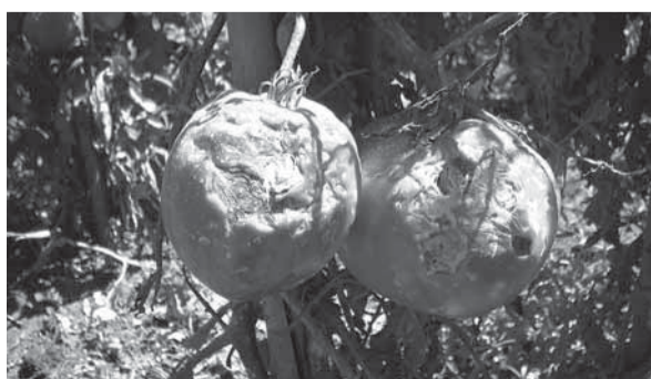
Quanto resta di due pomodori flagellati dalla grandinata

Il Comune, intanto, ha diffuso un avviso in