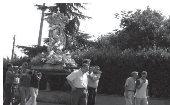
La processione della Madonna del Carmine

PIAZZO. In tanti hanno partecipato alla festa patronale della Madonna del Carmine, nella piazza Comune Antico della frazione Piazza, svoltasi da venerdì 17 a domenica 19 luglio ed organizzata dalla Pro loco piazzese. Oltre alle serate danzanti, è stato apprezzato il banco gastronomico, con le sue tradizionali specialità. Molto sentita la tradizionale processione religiosa della Madonna del Carmine, svoltasi nella mattinata della domenica. Successo anche degli intrattenimenti con gli animali della fattoria dei Babaci di Lauriano.