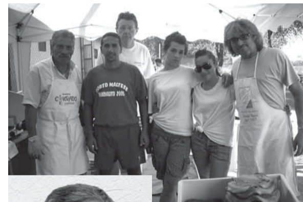
I cuochi volontari del torneo

campi. Ha funzionato un servizio bar e panini curato dagli amici dell'Asd Lauriano. Ha vinto il bar Piazzetta di Brandizzo,