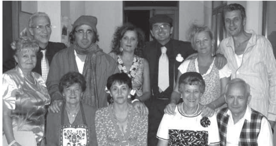
La compagnia delle "Boje 'd San Mò" ha registrato un grande successo

BROZOLO. (t.b.r.) Successo della prima "Festa di Fine Estate", voluta dall'Amministrazione comunale e dalla Pro Loco. Si è svolta nelle serate di venerdì 11, sabato 12 e domenica 13 settembre, con una grande partecipazione di pubblico.