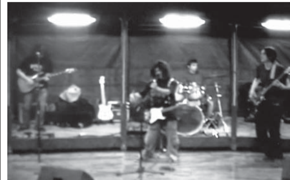
I Funk Anonymous durante il concerto svoltosi a Brozolo

In concerto venerdì 16 al liceo di Chivasso