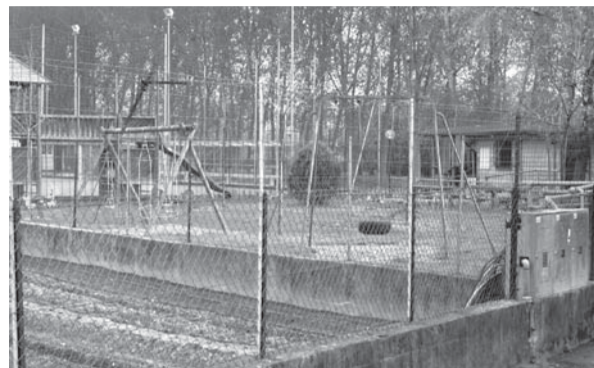
L'area degli impianti sportivi di via Marconi