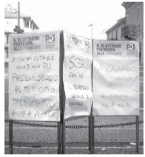
L'ingresso del seggio Pd