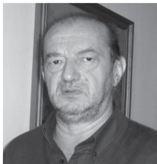
Il sindaco Beppe Valesio

VERRUA SAVOIA. In località Ciapel Bracco di Verrua Savoia sorgerà una centrale fotovoltaica, che convertirà la luce solare in energia elettrica. È un progetto a cui il Comune verruense, guidato dal sindaco Beppe Valesio, sta lavorando in silenzio da alcuni mesi. L'area di Ciapel Bracco, scelta dall'Amministrazione, in passato fu un sito adibito a discarica autorizzata. «Si tratta di un terreno - spiega il primo cittadino Valesio - che rimarrà di proprietà del Comune e verrà dato in concessione per vent'anni alla società che allestirà la centralina fotovoltaica». Tutto è nato dall'esame del bando emesso dalla Regione Piemonte il 6 ottobre dello scorso anno. Si tratta di un progetto cofinanziato dal Fondo Europeo, che comporterà l'avvio di una procedura di selezione pubblica delle società proponenti per la costruzione a Ciapel Bracco della centrale fotovoltaica. Una procedura