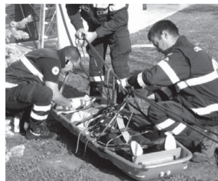
La simulazione del salvataggio di un ferito