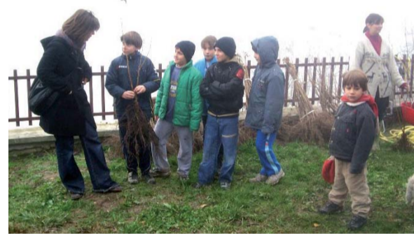
Gli alunni con le maestre durante la piantumazione