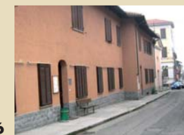
A PAG. 26

E' battaglia sull'acquisto dell'ex Cottolengo