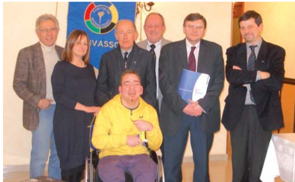
La consegna del contributo del Panathlon alla sezione Uildm