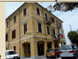
A PAG. 22

Targa di identificazione per i dipendenti a contatto con i cittadini