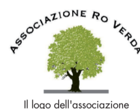
Il logo dell'associazione

SAN SEBASTIANO PO. E' Nata l'associazione sovramunicipale per il territorio "Attorno alla Ro Verda", del quale fanno parte cittadini di San Sebastiano Po, Casalborgone, Bersano San Pietro e Castagneto Po. Si tratta di un gruppo di persone professionalmente impegnate in attività inerenti alla gestione ambientale e territoriale che, senza scopo di lucro, intende mettere a disposizione di tutti la propria competenza multidisciplinare (naturalistica, forestale, ambientale, architettonica e geingegneristica) per lo sviluppo di iniziative di valorizzazione delle risorse ambientali, in un'ottica di sostenibilità ed ecocompatibilità». La Ro Verda è l'albero monumentale